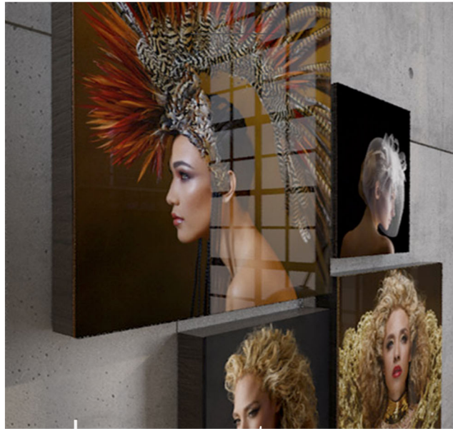
Le nec plus ultra Le Wall Art

Le plus beau design pour un rendu digne d'une galerie d'art